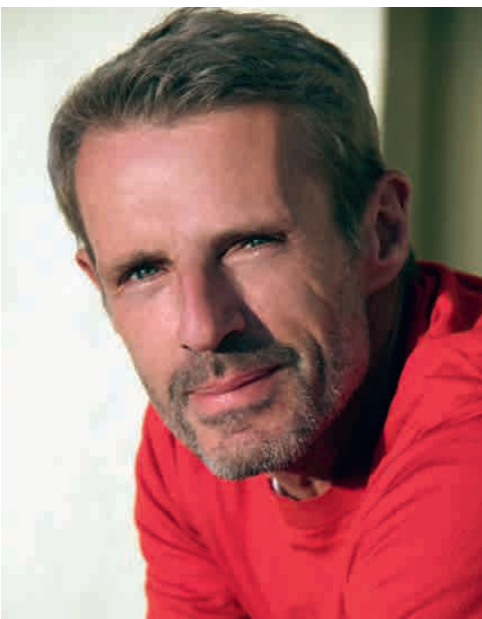
Le comédien Lambert Wilson. En concert les 4, 5 et 6 octobre.